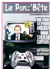
Le Ponc'Bête • n° 5