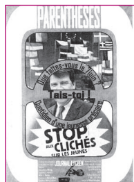
Parenthèses • n° spécial