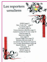
Les Reporters ursuliens • n° 1