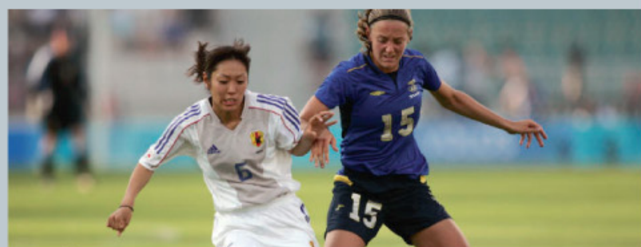
La distance séparant le respect de la violence est parfois courte. C'est au sportif de faire le bon choix.

« Soyez fair-play ! », « Un peu de fair-play, s'il vous plaît ! » : voilà des phrases qu'on entend souvent dans des situations où la tension guette et où le conflit risque d'éclater. Plus facile à dire qu'à faire ! Être fair-play peut vouloir dire plusieurs choses :