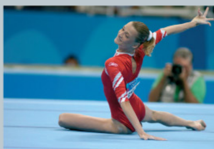
Dans les sports visant la performance individuelle tels que la gymnastique artistique ou certaines disciplines d'athlétisme, le fair-play se concentre plus sur le respect de soi et des règles.