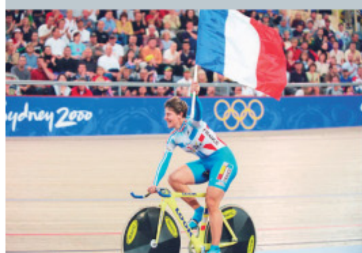
Du football à l'escrime, en passant par le judo, le vélo ou le badminton, c'est le rapport à l'autre qui introduit la nécessité de respect.