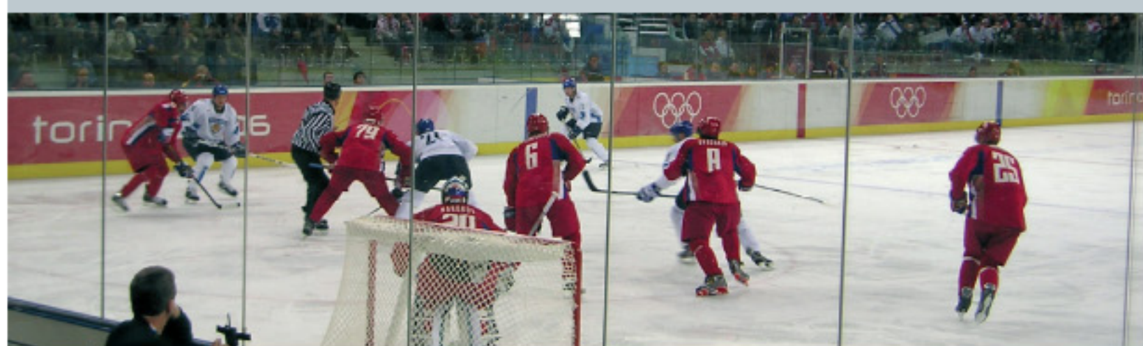
Les règles du hockey sur glace ont tendance à se durcir, on parle même de tolérance 0.

Le fair-play, c'est l'égalité devant les règles.