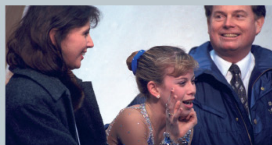
Pour soutenir le fair-play, il est capital que l'encadrement soit fondé sur le respect de l'athlète.

Les organisations sportives ont la responsabilité d'assurer des conditions de jeu qui permettent au fair-play et à la compétition de co-exister.