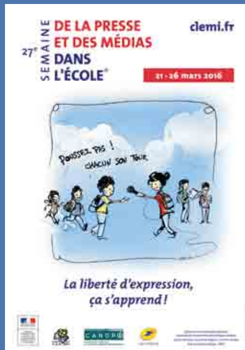
Illustration : © Ulric Leprovost Lauréat du concours de dessin de presse «Trophée Presse-Citron» organisé chaque année par l'École Estienne, à Paris.

Freedom of Expression National Monument – Foley Square, New York, 2004. Cette installation éphémère invite le public à venir s'exprimer.