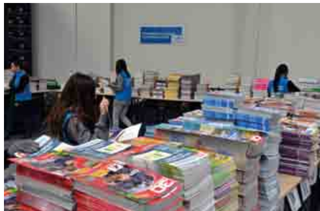
Confection des colis-presse sur la plateforme industrielle de Viapost-Industries de Chilly-Mazarin

Ce partenariat illustre l'engagement du Groupe La Poste en faveur de la découverte par les jeunes des richesses d'une presse pluraliste. En inscrivant son action dans la durée, La Poste entend faire bénéficier la Semaine de la presse et des médias dans l'École® du savoir-faire et des performances qu'elle déploie, au quotidien, dans le cadre de sa mission de service public en matière de transport et de distribution de la presse.