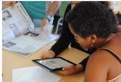
Réalisation d'une revue de presse © Rectorat