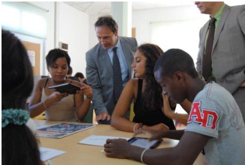
Inauguration de la 25 e Semaine de la presse par le Recteur

Le travail s'est ensuite poursuivi en salle de classe où le Padlet a été projeté afin de permettre à chaque binôme de présenter et justifier son choix.