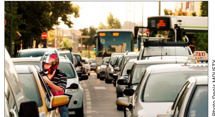
Les élus communautaires ont adopté la création d'un service visant à limiter l'impact environnemental de la voiture dans la ville.

Bouxières-aux-Dames L'écologie et le vélo pour des solutions innovantes