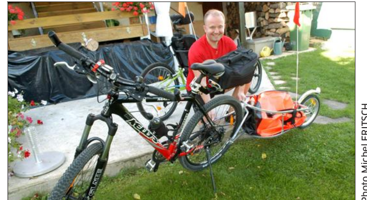
Des vélos qu'on ne trouve pas facilement, qui marient les dernières technologies et les nouvelles tendances du déplacement doux.

Diarville Fourgonnette contre un arbre : un mort